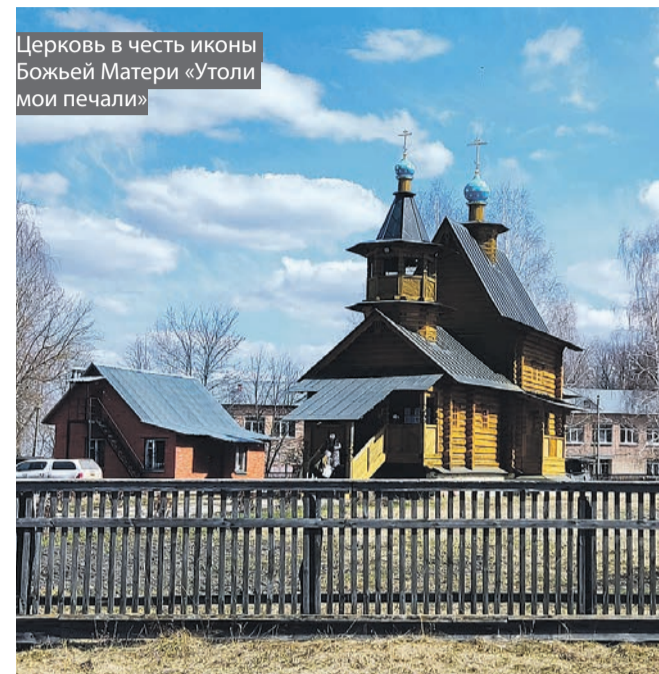
Церковь в честь иконы Божьей Матери «Утоли мои печали»