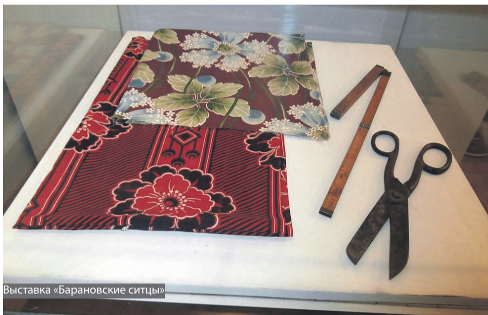
Выставка «Барановские ситцы»

В концертно-выставочном зале «На Грибоедова» (ул. Грибоедова, 26/6) желающие смогут побывать на иммерсивной выставке «Сотворение Родины», посвящённой кинорежиссёру и сценаристу Андрею Тарковскому. На ней показаны фотографии, плакаты,