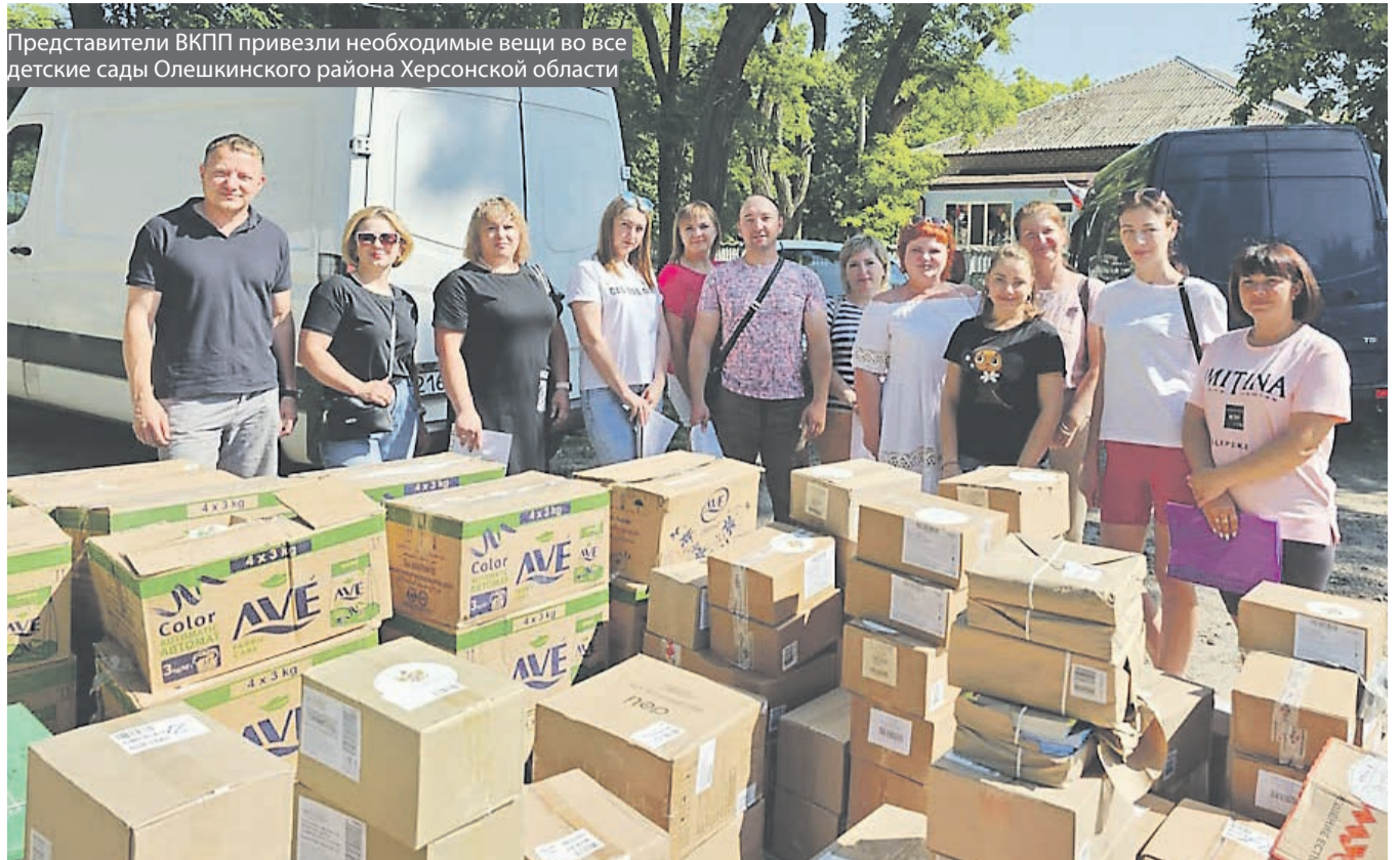
Представители ВКПП привезли необходимые вещи во все детские сады Олешкинского района Херсонской области