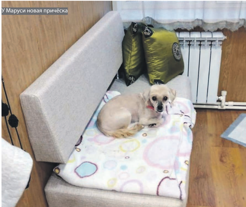
У Маруси новая причёска