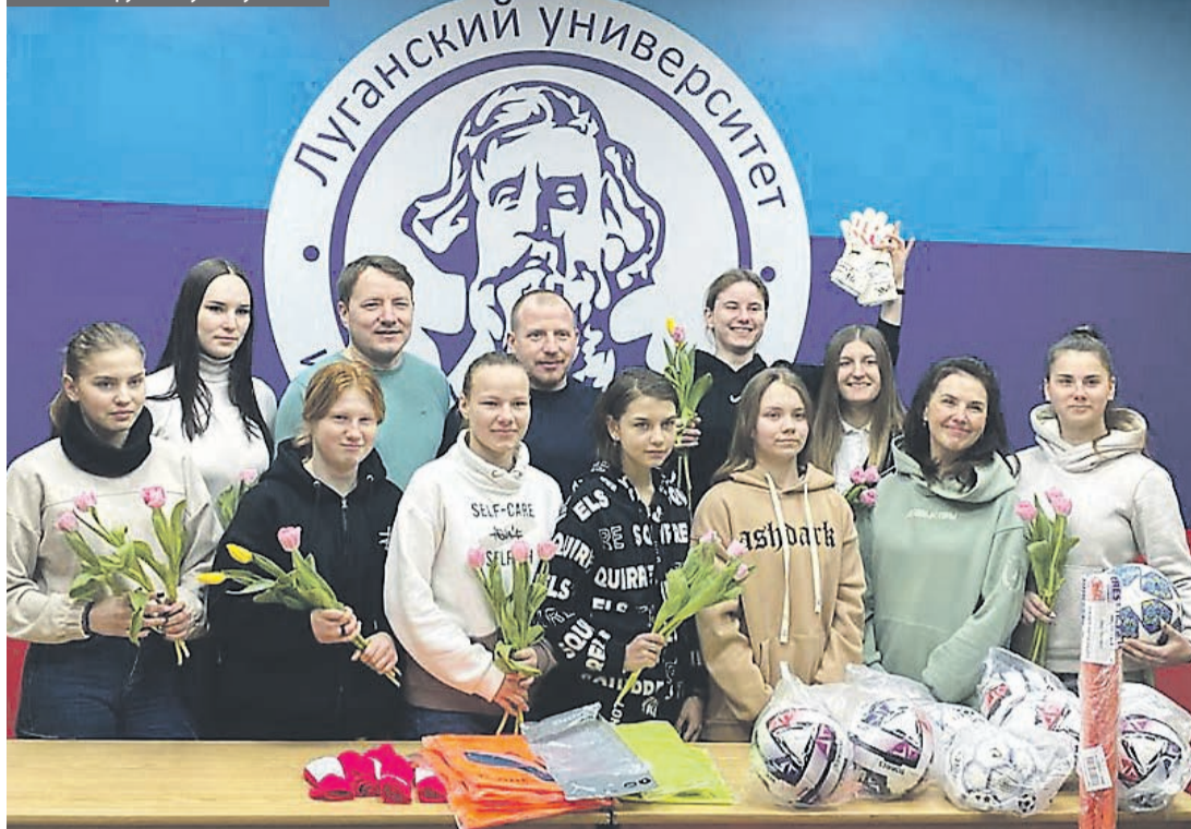
ВКПП помогает спортивной женской команде по мини-футболу г. Луганска