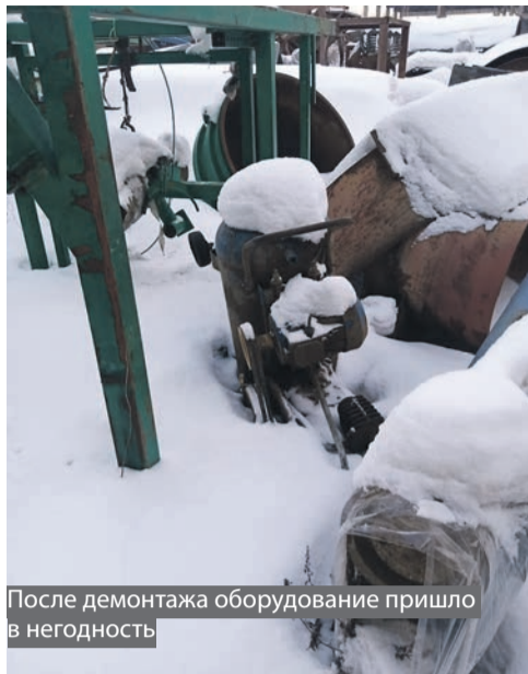
После демонтажа оборудование пришло в негодность