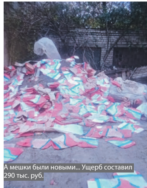
А мешки были новыми... Ущерб составил 290 тыс. руб.