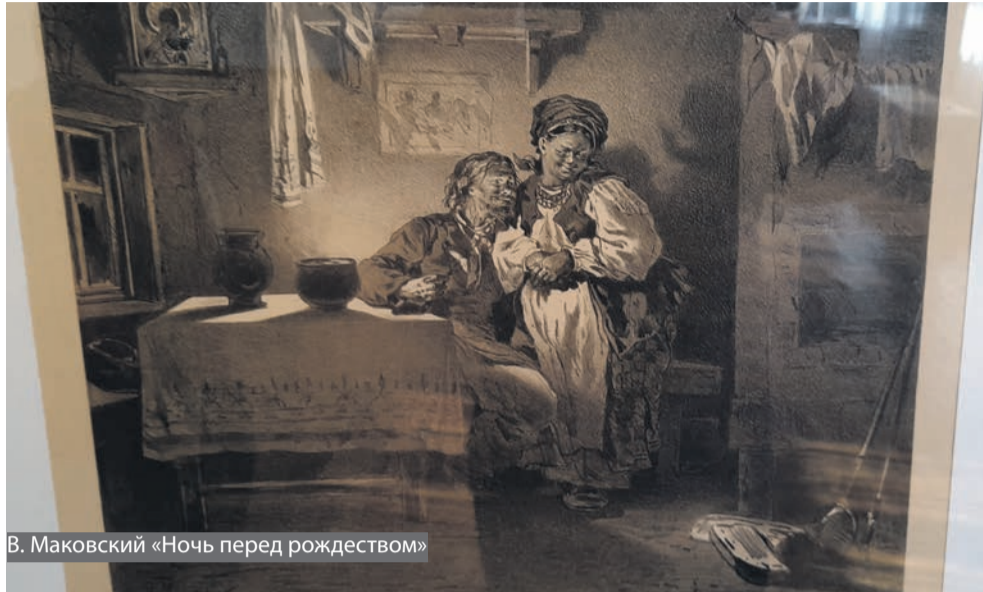
В. Маковский «Ночь перед рождеством»

Но чем дальше, тем меньше в творчестве Гоголя было юмора – и тем больше сатиры. Он высмеивал всех, кто мешал России развиваться, совершенствоваться, хорошееть, примеряя маску того же «простачка», который искренне не понимает, зачем быть скверным человеком и плохим работником, если можно быть нравственной личностью и