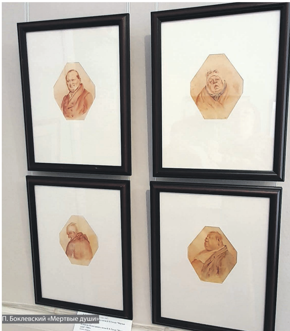
П. Боклевский «Мертвые души»

искренним служителем Отечества. Подобный стиль в дальнейшем нередко использовала политическая комедия, популярная и в советской литературе. Правда, у советских писателей объектом высмеивания становились всякие «несоветские элементы» или вообще «заокеанские враги», а у Гоголя – чиновники и прочие власть предержащие.